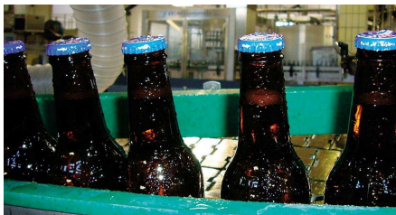
Flaschen vor Trocknung