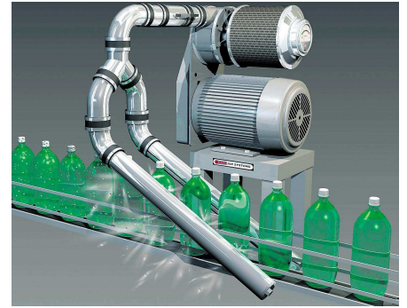
Einfache Ablasssysteme für Flaschen zum Beispiel vor Etikettierung, Sprühdosierung

Durch das Gehäuse aus Edelstahl kann das System auch im Nassbereich der Produktion eingesetzt werden. Es erfüllt die Anforderungen für Anlagen und Maschinen gemäß den geltenden Maschinenrichtlinien.