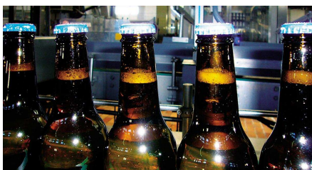
Flaschen nach Trocknung